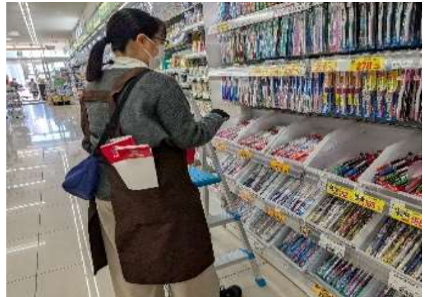
商品補充（店舗駐在チーム）