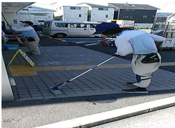
店頭タイル清掃（店舗巡回チーム）