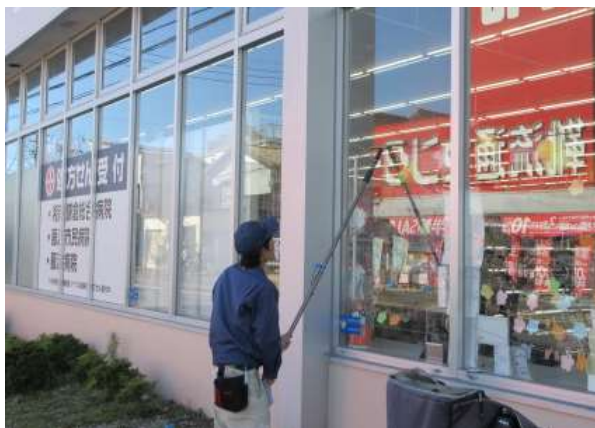
外窓清掃（店舗巡回チーム）