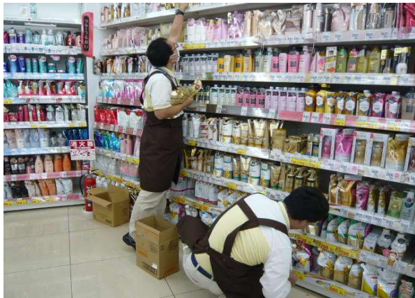
商品品出し（店舗駐在チーム）