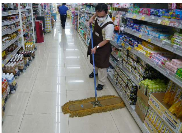
店舗床清掃（店舗駐在チーム）