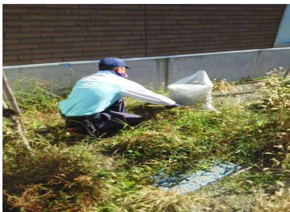
緑化業務（店舗巡回チーム）