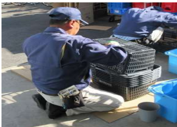
買い物かご清掃（店舗巡回チーム）