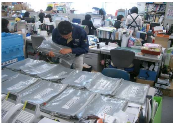
メール便仕分け（本社駐在チーム）