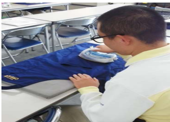
アイロンがけ（事業所作業）