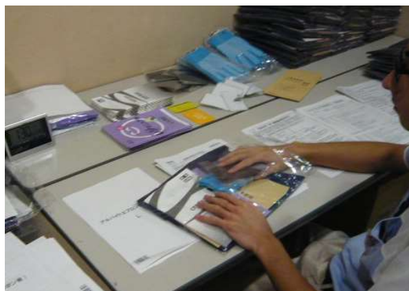
新規エプロンセット作成（本社駐在チーム）