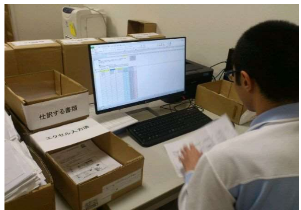
パソコン入力作業（本社駐在チーム）