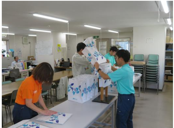
軽作業(百貨店向け手提げ紙袋の二重化)