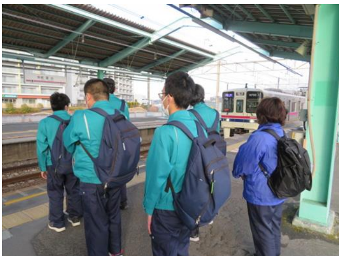
（午後の業務 ▶▶▶）担当職場から帰所