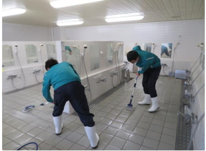
現業施設の浴室清掃