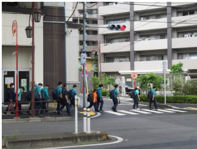
担当職場へ向け出発（▶▶ 午前の業務）