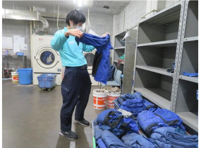
車両工場での洗濯業務