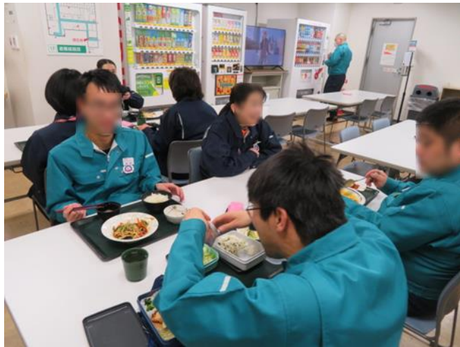
楽しい昼食の時間