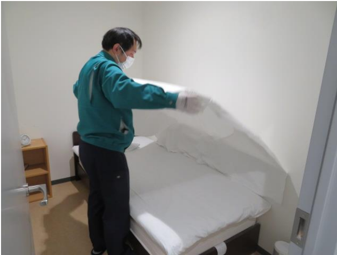
乗務員仮眠室のベッドメイキング(シーツ交換)