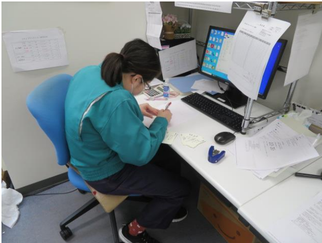
グループ各社向けの名刺作製業務