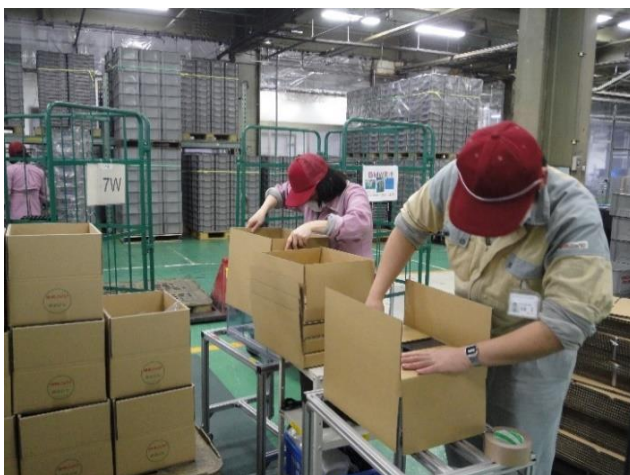
段ボール組み立て作業