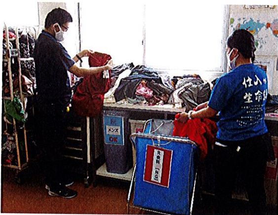
海外発送用の衣料仕分け