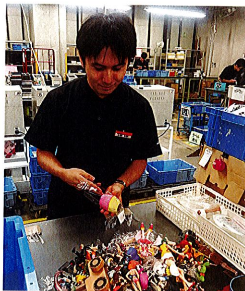
海外店舗向け 商材加工