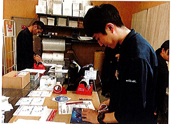
商品梱包・発送作業