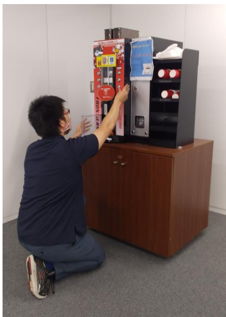
コーヒーサーバーメンテナンス