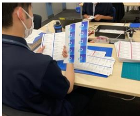
【社内では】 名刺作成業務実施中

また、稼いだお給料で、友達と遊びに行ったり、家族にご飯をご馳走したりと社会人としての楽しみも増えました。