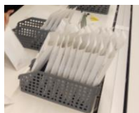
封筒・キットは10個ずつ