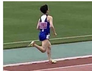
【社外では】 第2回全国障害者スポーツ大会（とちぎ大会）参加