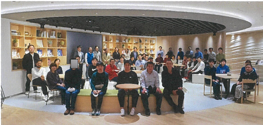
日本ロリアル(株)新宿本社