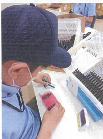
ボトル等曲面へのラベル貼り