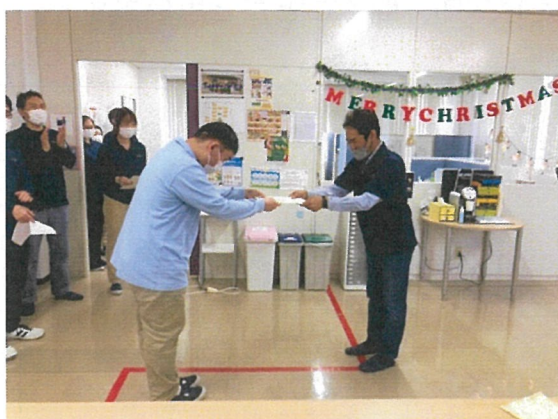
永年勤続表彰 (5年/10年)