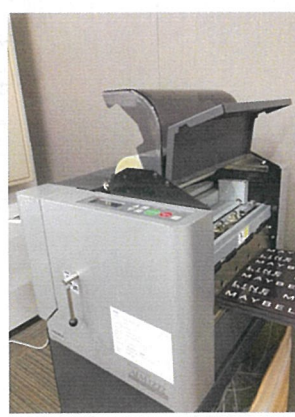
自動パウチマシン