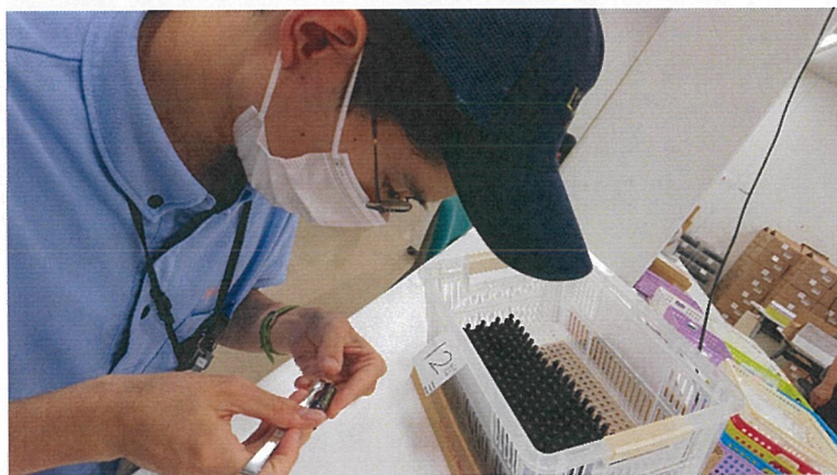
ピンセットを使ったラベル貼り