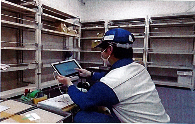
需品管理（受入れ→引渡し）