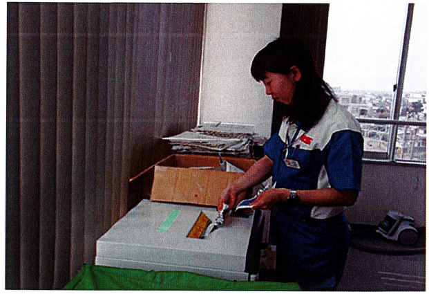
機密処理（シュレッダー）作業