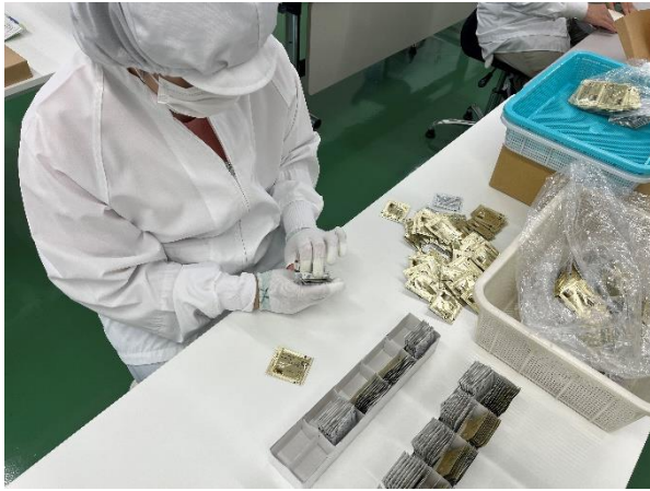
化粧品サンプル結束業務