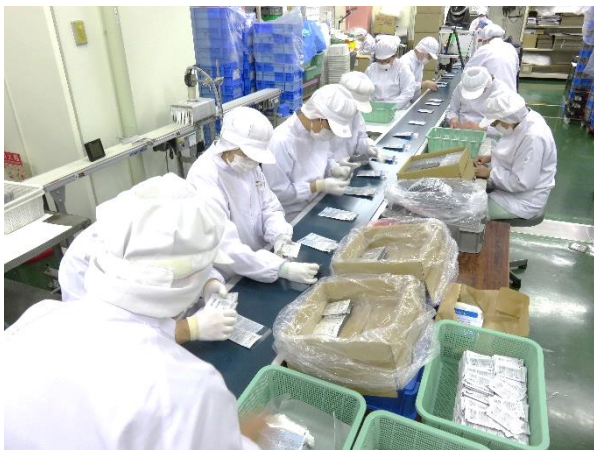
化粧品／サプリメント包装業務