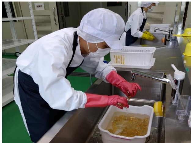
容器洗浄（リサイクル）業務