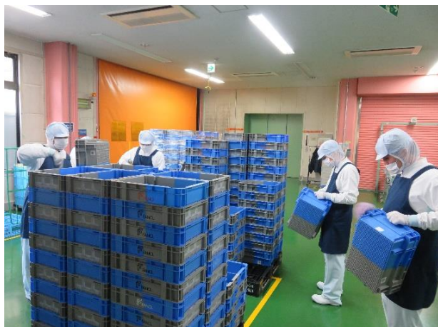
コンテナ清掃業務（千葉）