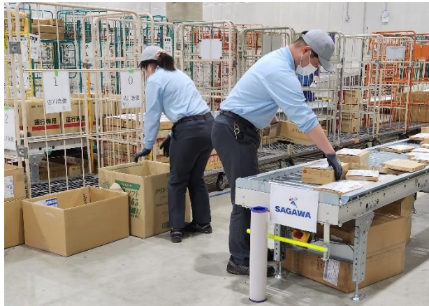
物流補助業務（大阪）