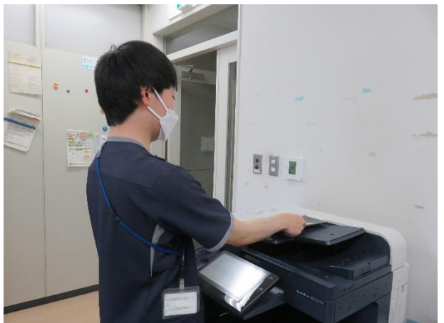
資料スキャン業務