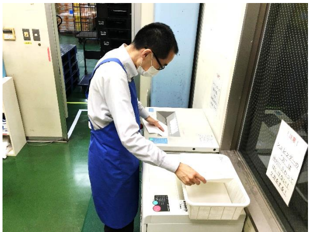
シュレッター業務