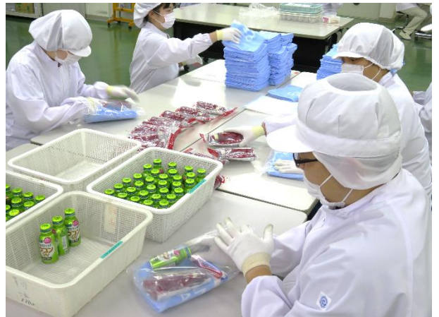
キャンペーン用商品セット業務