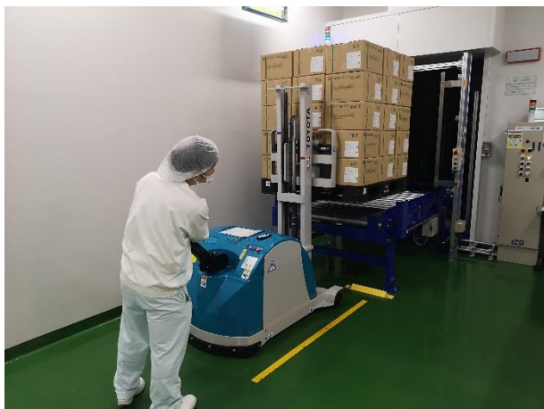
フォークリフト等による運搬業務（千葉）