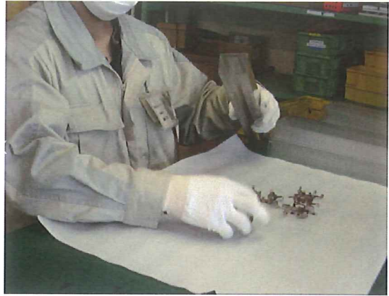
電子部品ケース入れ作業