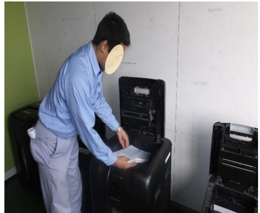
～シュレッダー作業～