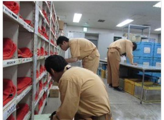
メールセンター（郵便物の仕分け）