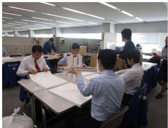
顧客配布用カレンダーの発送