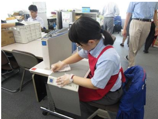
事務用品のリユース（再生）