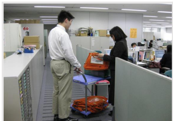
社内メール便の配達及び集荷