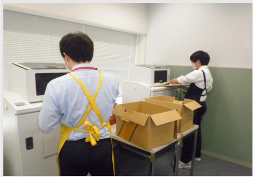
シュレッダー業務