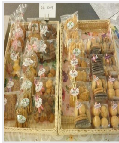
パンやクッキーの販売