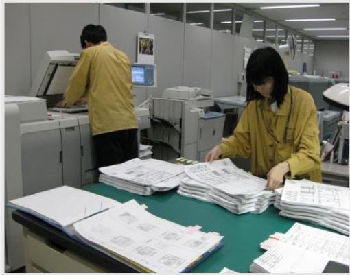
コピーセンター（印刷・製本）